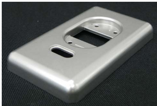
ステンレス(CNC切削のまま)